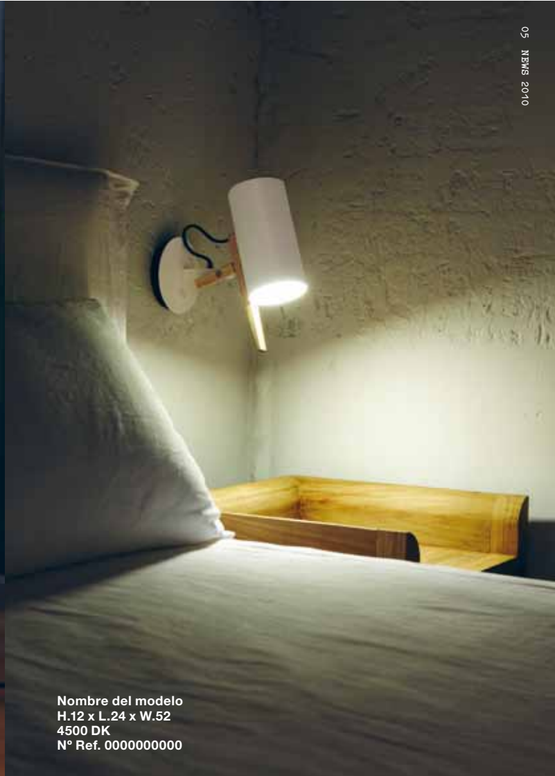
Nombre del modelo H.12 x L.24 x W.52 4500 DK N° Ref. 0000000000