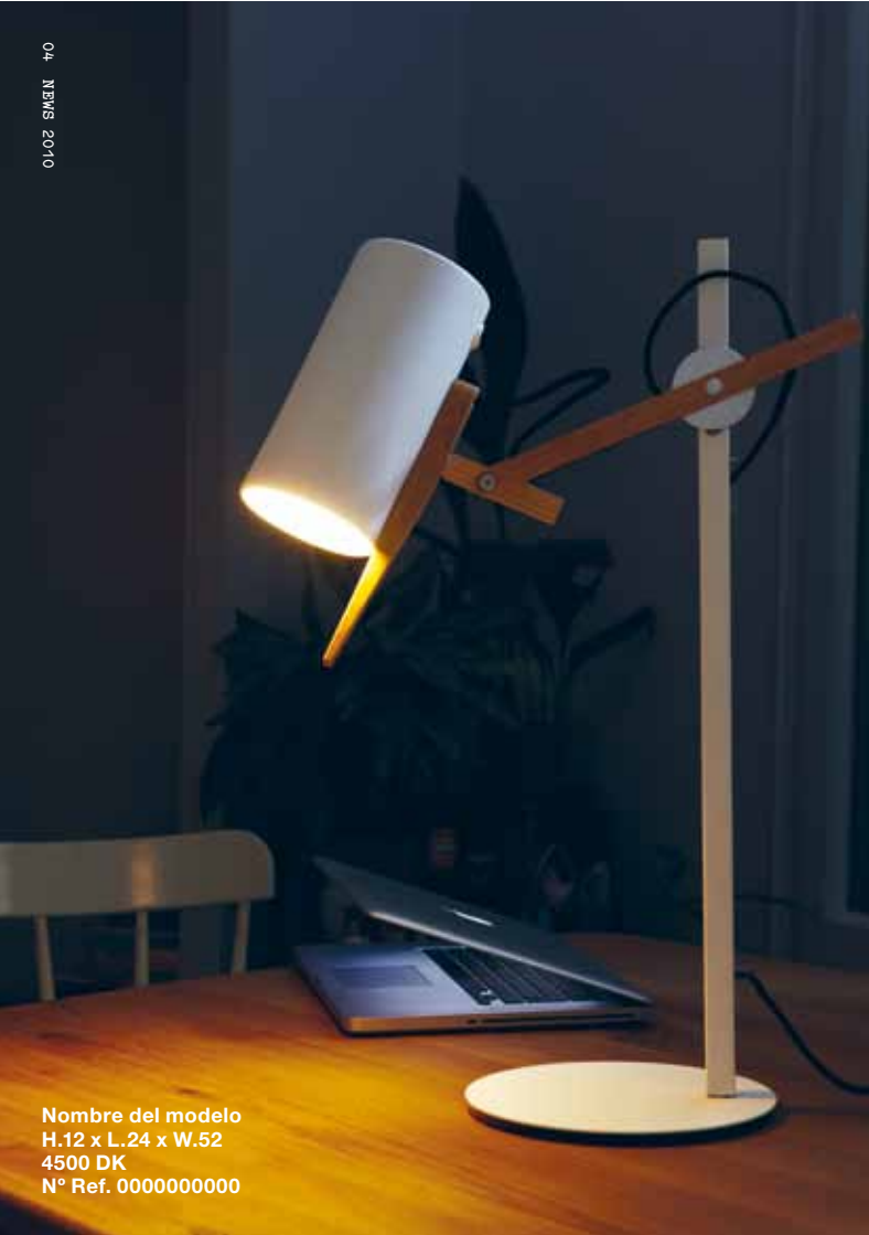
Nombre del modelo H.12 x L.24 x W.52 4500 DK N° Ref. 0000000000